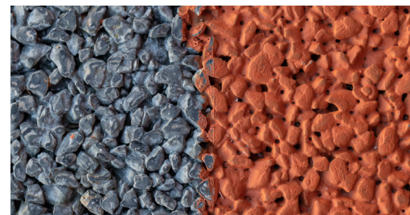
Detalhe do Sistema DRAIN SELECT